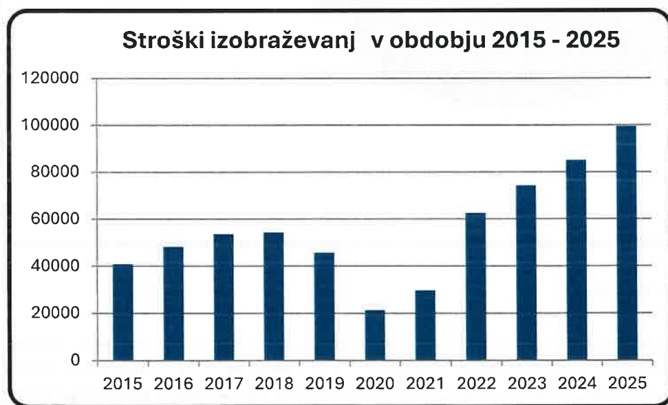
Graf stroški izobraževanj (€)

V primerjavi s preteklim letom so nam stroški izobraževanj porasli za 17 %.